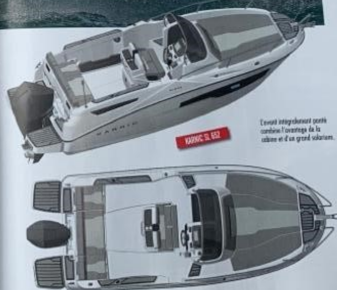
KARNIC SL 652

Ce plan de pont permet de circuler sans gêner autour de la console centrale - parfait pour la pêche.